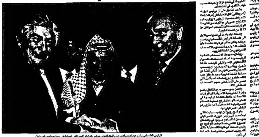
الرئيس الفلسطيني ياسر عرفات يصف نتنياهو بـ"الرجل الذي يبيع فلسطين" في مقابلة مع قناة الجزيرة.

الفلسطينيون يؤكدون تمسكهم بالمرحلة الثالثة من إعادة الانتشار